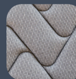
表面生地 (ニット生地)